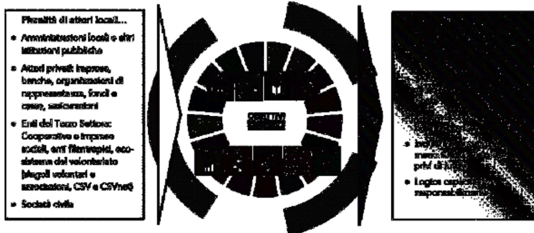
Figura 2.3. Il secondo welfare e gli Obiettivi di Sviluppo Sostenibile dell'Agenda 2030