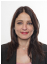
• LICATINI Caterina - MOVIMENTO 5 STELLE in sostituzione del Sottosegretario di Stato per il Lavoro e le politiche sociali COMINARDI Claudio