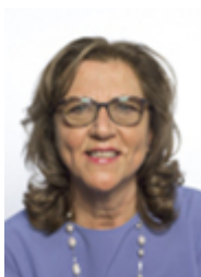
• CASA Vittoria - MOVIMENTO 5 STELLE