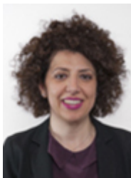
• VIZZINI Gloria - MOVIMENTO 5 STELLE