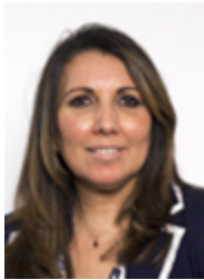
• DE LORENZO Rina - MOVIMENTO 5 STELLE