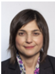
• SERRACCHIANI Debora - PARTITO DEMOCRATICO