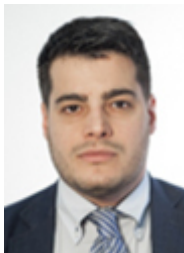
• TUCCI Riccardo - MOVIMENTO 5 STELLE