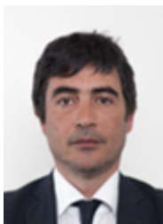
• FRATOIANNI Nicola - LIBERI E UGUALI