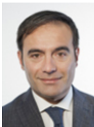
• SASSO Rossano - LEGA - SALVINI PREMIER