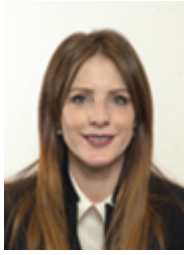
• LORENZONI Eva - LEGA - SALVINI PREMIER