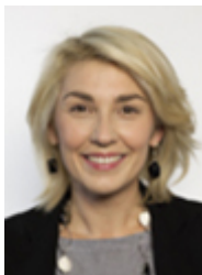
• GIANNONE Veronica - MOVIMENTO 5 STELLE