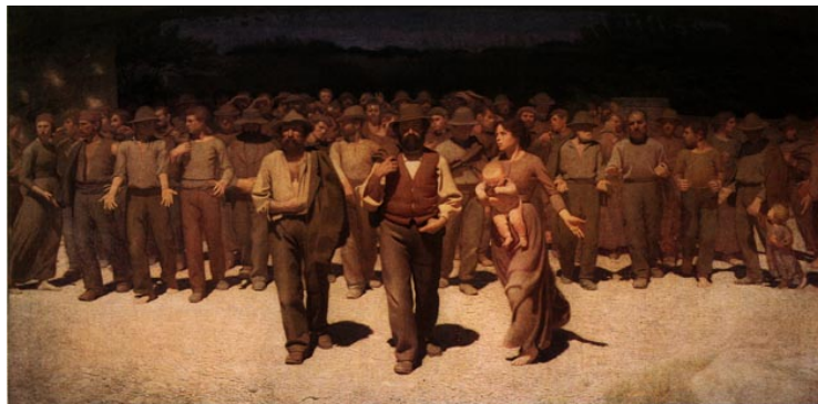
Fig. 4: Il quarto Stato , Giuseppe Pelizza Da Volpedo, 1896-1902, olio su tela, 295x545 cm., Museo del Novecento, Milano.