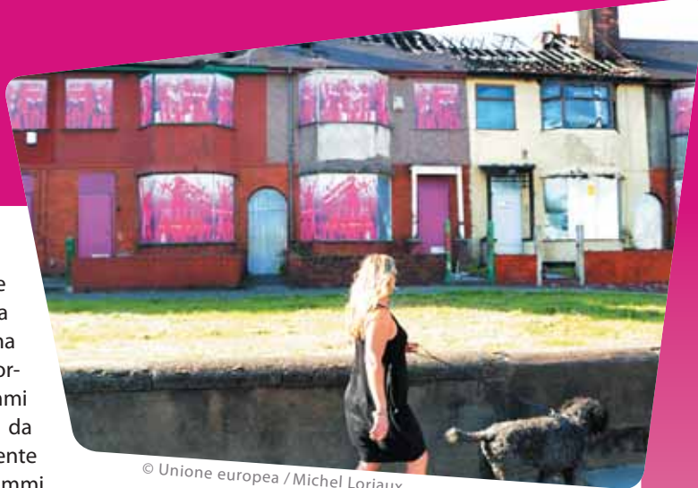
© Unione europea / Michel Loriaux

La sperimentazione sociale richiede una preparazione e una scelta accurate. La portata dei programmi dovrebbe essere tale da renderli politicamente pertinenti e i programmi