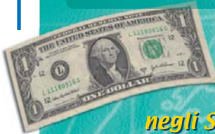
Dollaro negli Stati Uniti