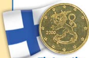
Finlandia 50 centesimi Leone araldico, ripreso da un'opera dello scultore Häiväoja