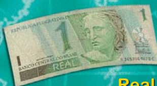
Real in Brasile