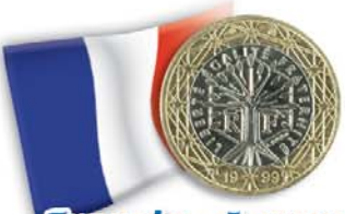
Francia - 1 euro Albero della vita con il motto repubblicano "liberté, égalité, fraternité"