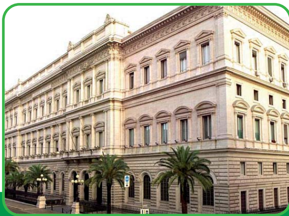
Roma, Palazzo Koch, sede della Banca d'Italia

La Banca centrale della Repubblica Italiana è la Banca d'Italia.