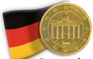
Germania 50 centesimi Porta di Brandeburgo, simbolo della divisione (1949) e successiva unificazione della Germania (1990)