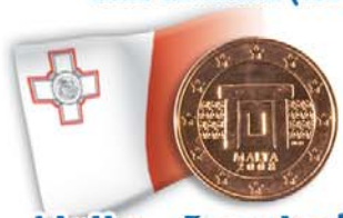
Malta - 5 centesimi Altare del tempio preistorico di Mnajdra (3600 a. C.)