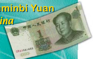
Renminbi Yuan in Cina