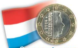
Lussemburgo 1 euro Granduca Enrico