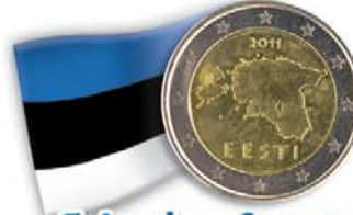
Estonia - 2 euro Immagine geografica del paese