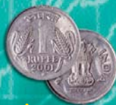
Rupia in India