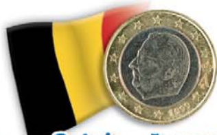
Belgio - 1 euro Re Alberto II