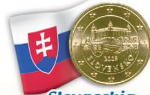
Slovacchia 50 centesimi Castello di Bratislava