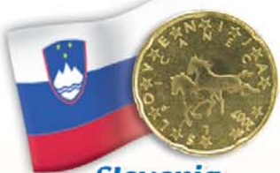
Slovenia 20 centesimi Cavalli lipizzani