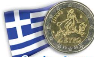
Grecia - 2 euro La ninfa Europa rapita da Giove nelle sembianze di un toro