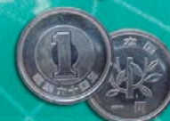
Yen in Giappone