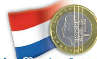
Olanda - 1 euro Regina Beatrice