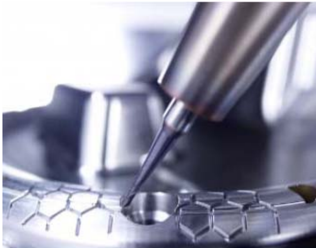
Mould- and Die industry