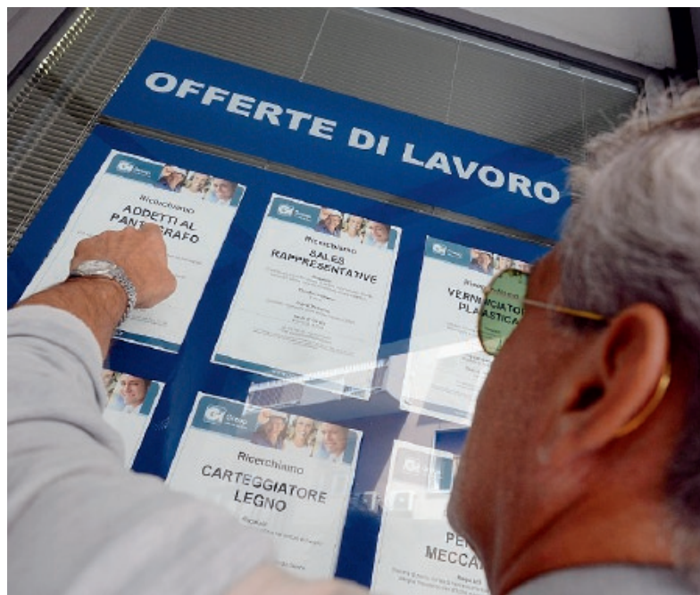
AUMENTANO IN SICILIA LE ASSUNZIONI CON INCENTIVO

Una misura che ha meno successo, ma che sta comunque avanzando, è il bonus Occupazione Giovani, che ha sostituito il bonus Garanzia Giovani e che incentiva l'assunzione di giovani Neet fino a 29 anni che hanno aderito al precedente programma Garanzia Giovani. L'incentivo equivale sempre allo sgravio contributivo fino a 8.060 euro in un anno per assunzione a tempo indeterminato. In Sicilia a fine 2017 risultano impiegati con questa misura 1.232 giovani, con un incremento di circa 200 soggetti a confronto con