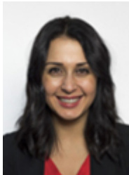
• CARBONARO Alessandra - MOVIMENTO 5 STELLE