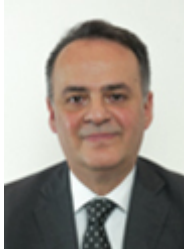
• CUBEDDU Sebastiano - MOVIMENTO 5 STELLE