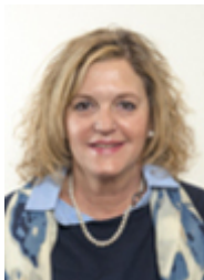
• LEGNAIOLI Donatella - LEGA - SALVINI PREMIER