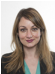
• SEGNERI Enrica - MOVIMENTO 5 STELLE